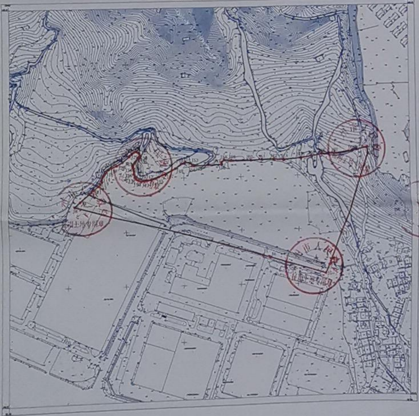
用地界址图(地块三)