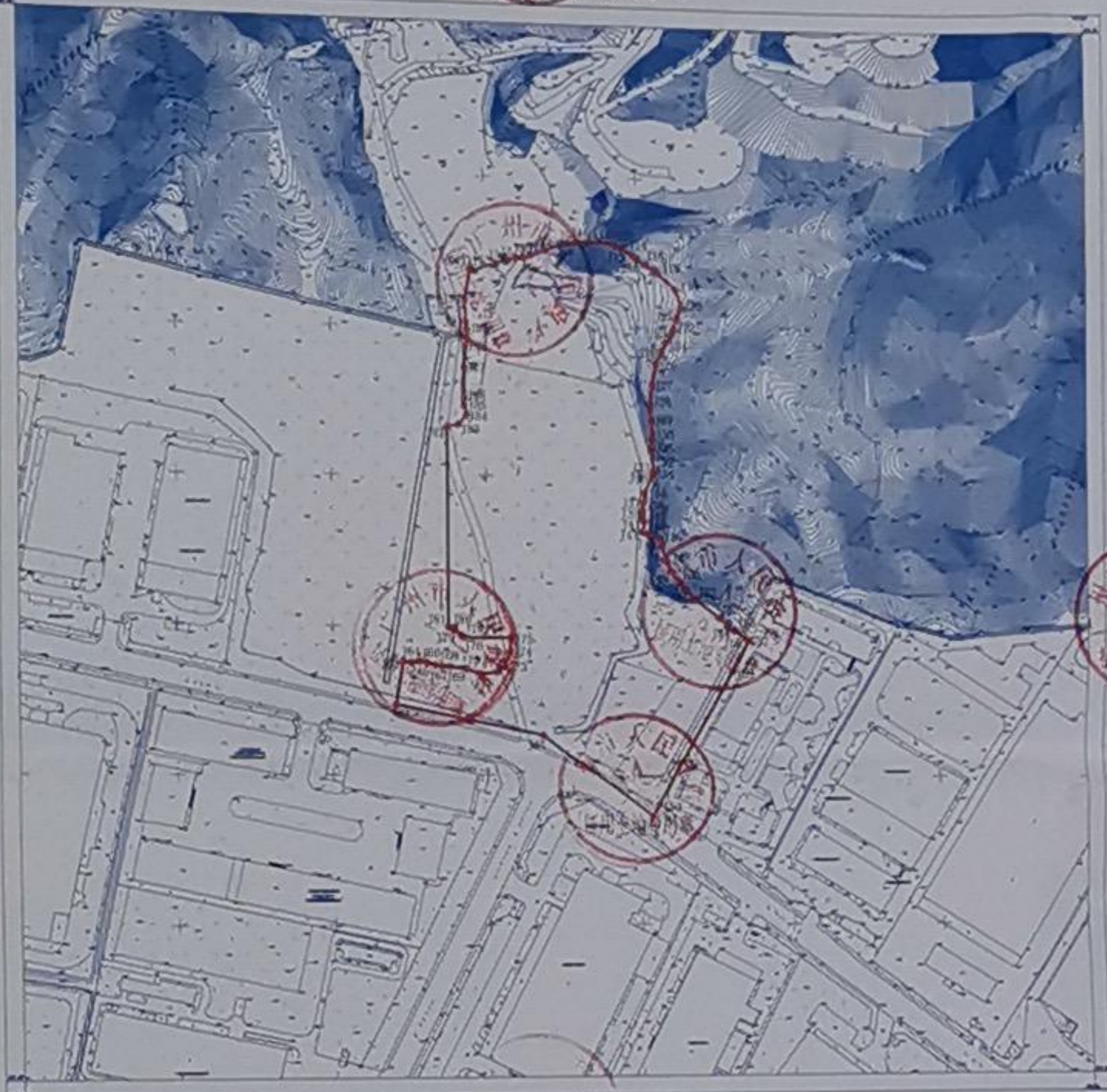
用地界址图(地块一)