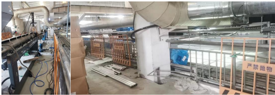
顶棚外围围蔽情况（开孔作业前）