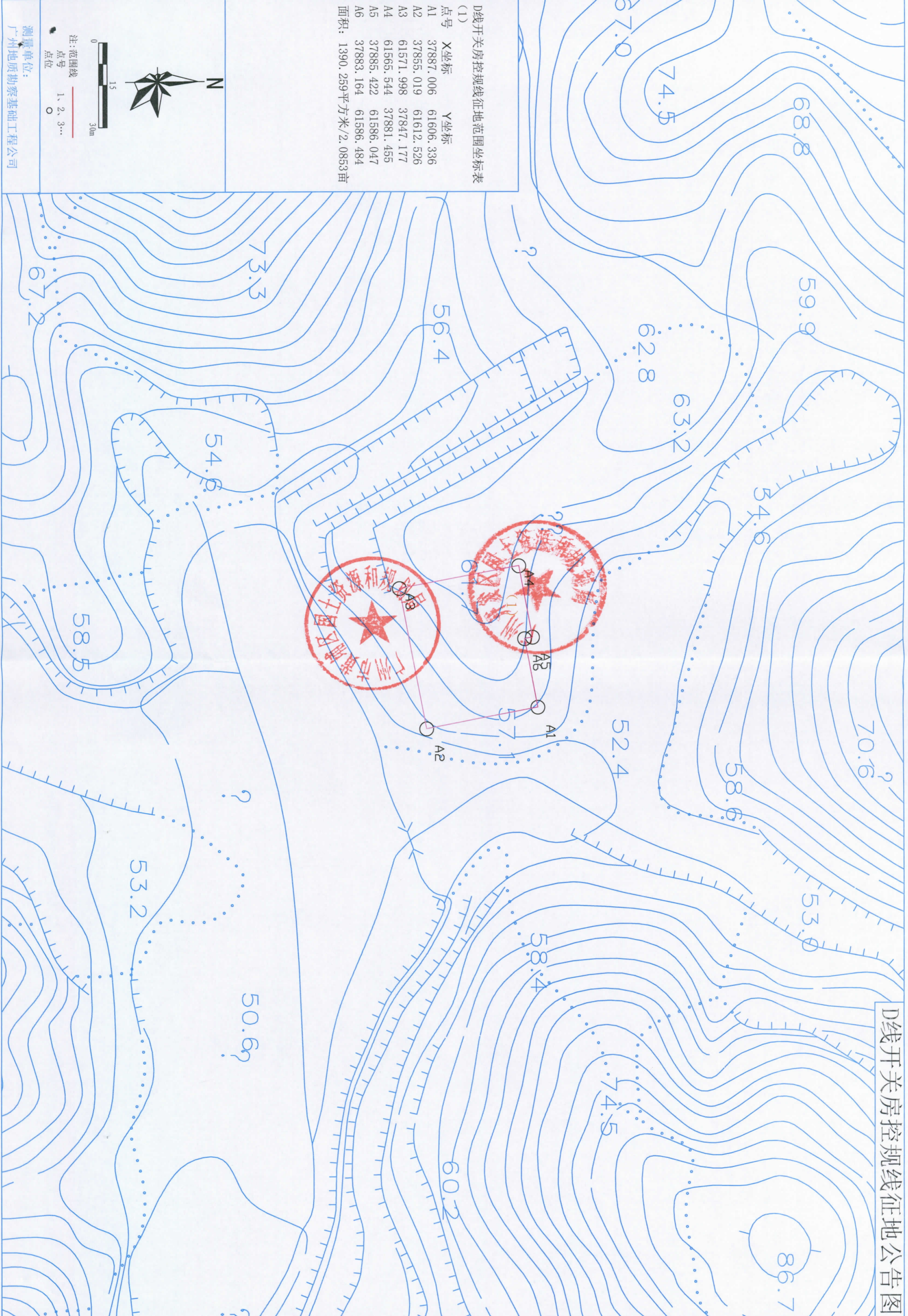
D线开关房控规线征地范围坐标表