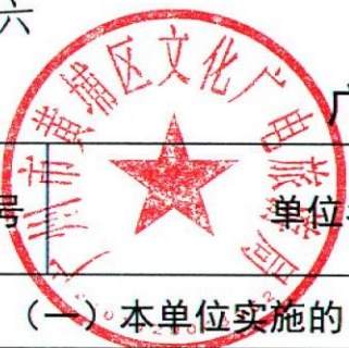
广州市黄埔区文化广电旅游局 2020 年度行政检查实施情况统计表