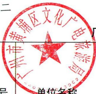
广州市黄埔区文化广电旅游局 2020 年度行政处罚实施情况统计表