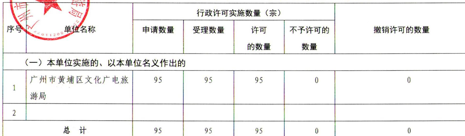
广州市黄埔区文化广电旅游局 2020 年度行政许可实施情况统计表