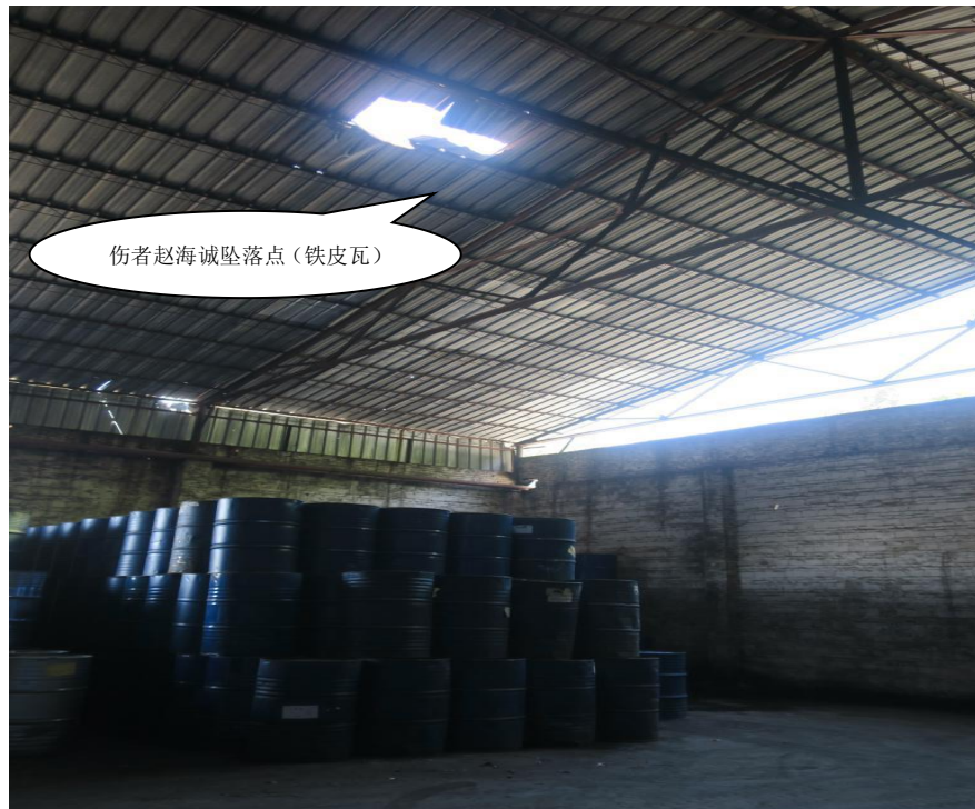
图 2: 事故现场图 (广州市利程通仓储有限公司 1 号仓库)