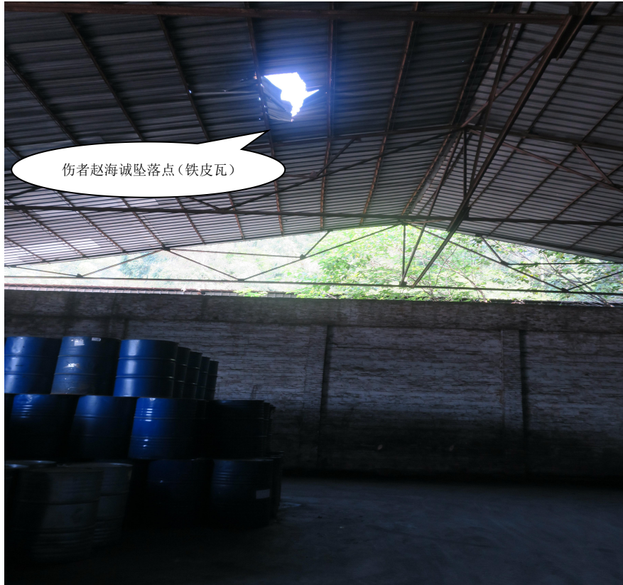
图 1: 事故现场图 (广州市利程通仓储有限公司 1 号仓库)