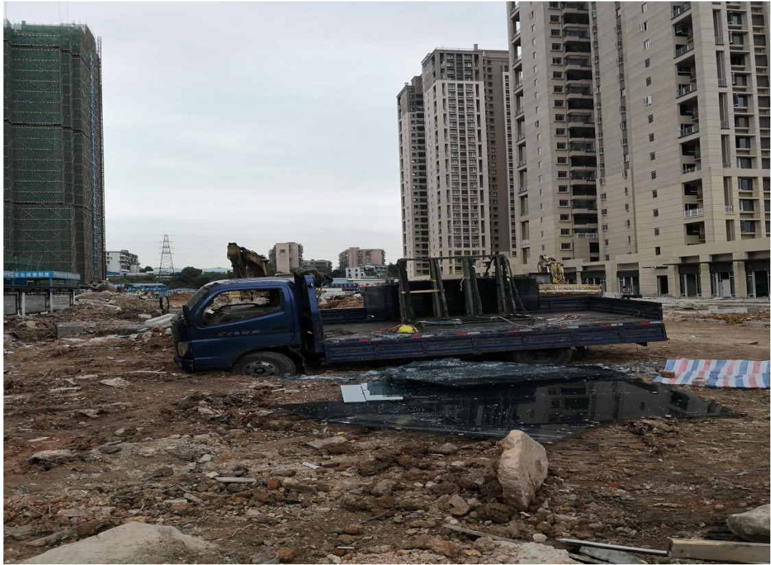
图 1 事故现场图片